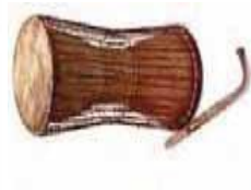
Τύμπανο που μιλά